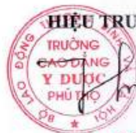
Ths Hà Thanh Hoà

Người học được phép liên thông lên các bậc học cao hơn nếu đáp ứng đủ các tiêu chí trong quy chế tuyển sinh hiện hành đề ra.